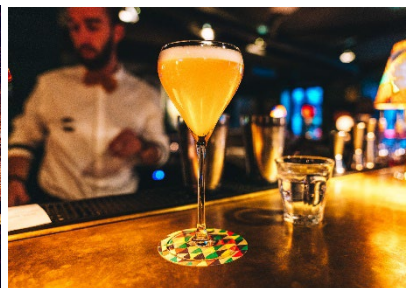
V. l. n. r. Das RIBELLI im 25hours Hotel beim MuseumsQuartier in Wien, die Monkey Bar im 25hours Hotel Bikini Berlin in Berlin und die Sape Bar im 25hours Hotel Terminus Nord in Paris.