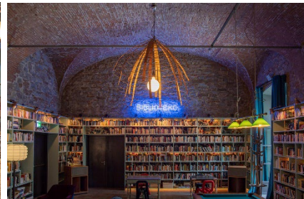
V. l. n. r. Das 25hours Hotel Bikini Berlin in Berlin, das 25hours Hotel One Central in Dubai und das 25hours Hotel Piazza San Paolino in Florenz.

Der Grundstein für 25hours wurde 2003 gelegt. Damals betrieb der inzwischen mehrfach ausgezeichnete Hotelier Kai Hollmann sein erstes eigenes Hotel, das Gastwerk, auf einem alten Fabrikgelände in Hamburg Bahrenfeld. Nur 200 Meter entfernt befand sich eine leerstehende Immobilie. Es entstand die Idee, ein weiteres Hotel zu schaffen als dynamische Ergänzung zum ikonischen Loft-Hotel. Im November 2003 wurde nach einem zwölfmonatigen Umbau das erste 25hours Hotel eröffnet. Das Haus sollte etwas jünger daherkommen als die klassische Hotellerie und schon damals kommunikative Menschen zusammenbringen. Ein Ort für Designliebhaber sollte es sein, die Wert auf ein faires Preis-Leitungsverhältnis legen. Die Partyreihen der Gründerjahre werden von manchem Hamburger noch immer als legendär bezeichnet. Bis heute hat Hollmann diverse weitere Hotelkonzepte realisiert. Bruno Marti, Executive VP of Brand Marketing bei 25hours Hotels, sagt: „Der Erfolg hat immer viele Mütter und Väter. Die Initialzündung zu diesem Projekt kam vom visionären Kai Hollmann. Die Marke an sich wurde dann auf den Schreibtischen von Ulrike Fohr (damals Marketingdirektorin des Gastwerk Hotels) und Remo Masala (CMO Design Hotels) entwickelt. Das Design des ersten Hauses kam aus der Feder von Dreimeta – das Augsburger Design-Team hat bis heute drei weitere 25hours Hotels gestaltet. Damit aus dem One-Hit-Wonder schließlich eine globale Hospitality-Marke wurde, waren noch ein paar mehr Mitstreiter nötig.“